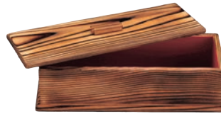
③焼杉 はし箱 (内朱)