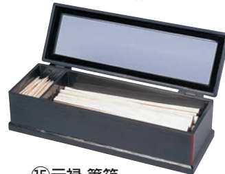
⑮元禄 箸箱 黒淵朱 (楊枝入付)